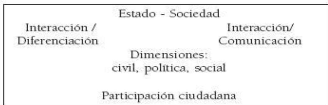
Figura 0.1.1. Conformación de la participación ciudadana.

Figura 1.1. El esquema muestra la forma en la que se constituye la participación ciudadana a través de la diferenciación y la comunicación dada entre el estado y la sociedad en las dimensiones civil, política y social. Fuente: Espinoza, M. (2009). Revista Andamios , 5(10), p. 99.